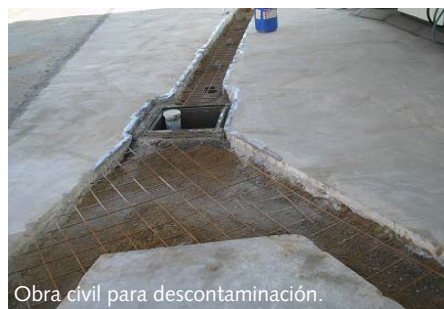
Obra civil para descontaminación.