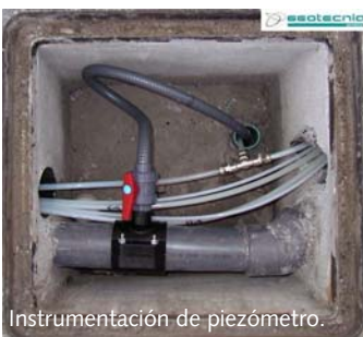
Instrumentación de piezómetro.