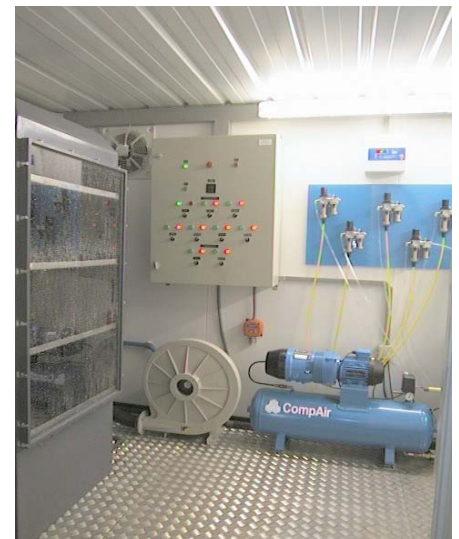
Interior de UTM.