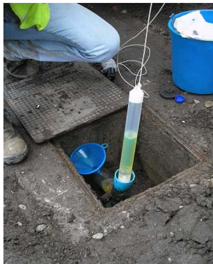
Recuperación de fase libre con bailer.