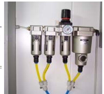
Regulador de presión de aire.